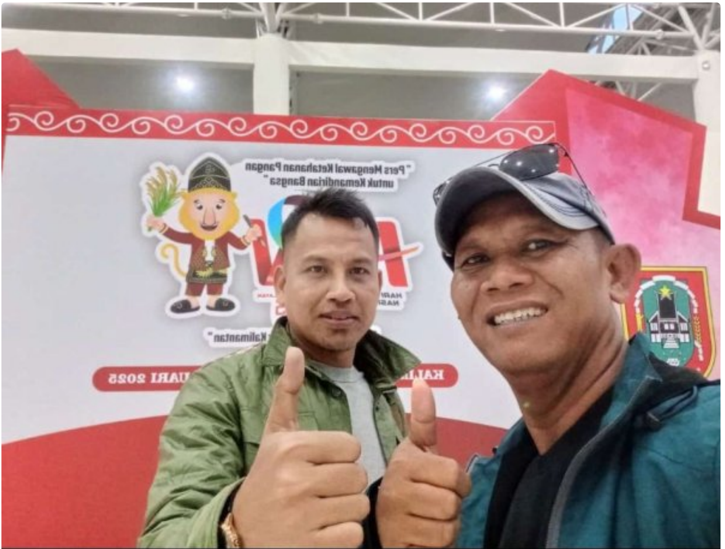
Sekretaris dan Bendahara PWI Kabupaten Morowali

MOROWALI, Sulawesi Tengah- Pengurus Persatuan Wartawan Indonesia (PWI) Kabupaten Morowali, Sulawesi Tengah menyatakan siap mengikuti puncak peringatan Hari Pers Nasional (HPN) di Banjarmasin, Kalimantan Selatan.