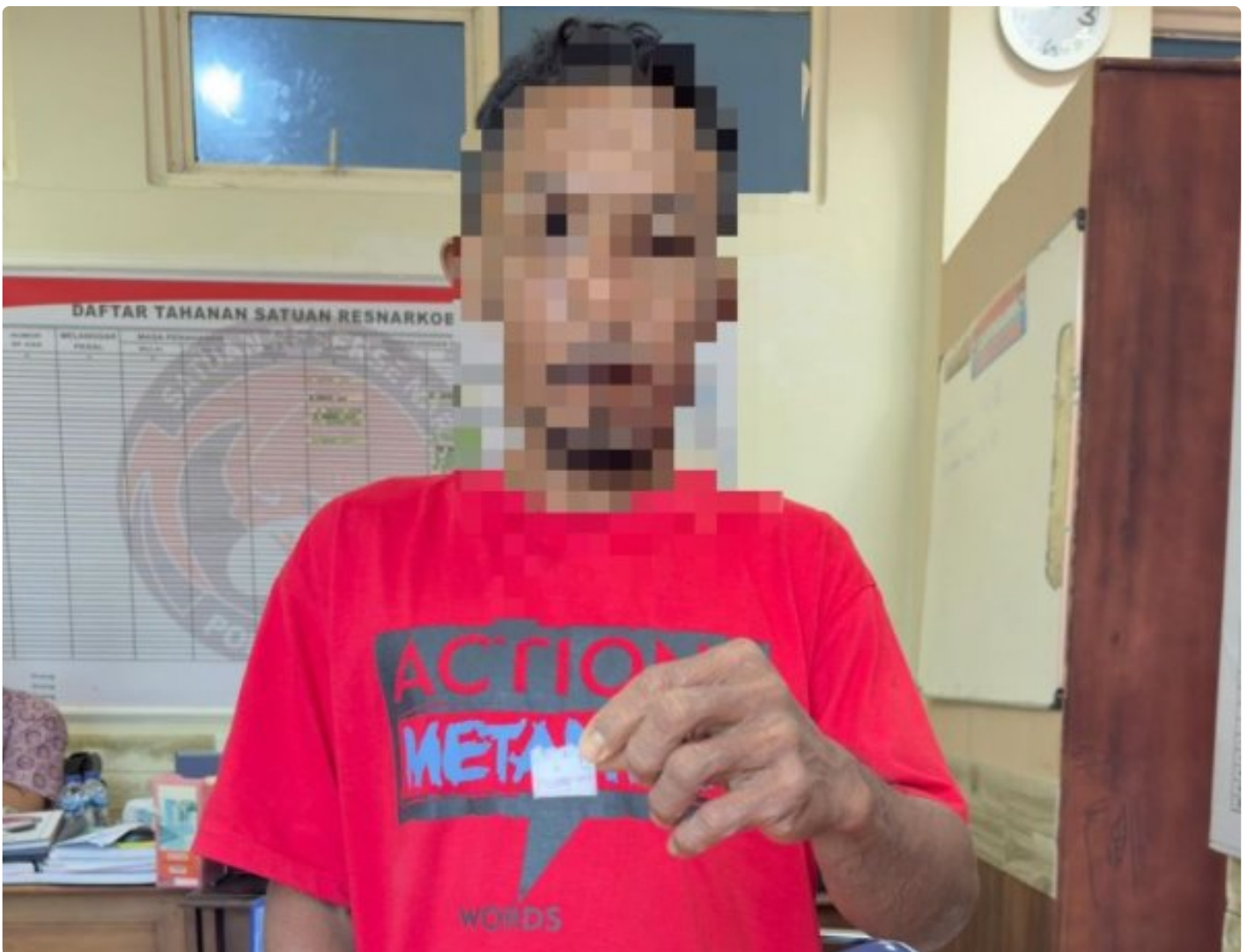
Pelaku Penyalahgunaan Narkotika jenis sabu diringkus dari Desa Lele